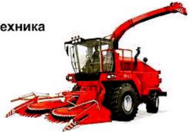
комбайн для уборки зерна

2. Игра «Сложные слова» (образование односложных слов – название специального транспорта).